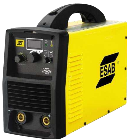
LHN 250i Plus

Конструкция аппарата LHN 250i Plus имеет высокую прочность, мощность, надежность и другие характеристики, которые облегчат вашу повседневную работу - например, цифровую панель индикации, длинные сварочные кабели и несколько ручек для переноса аппарата.